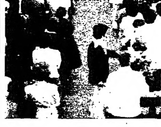
بشير الجميل يخطب في بدارو